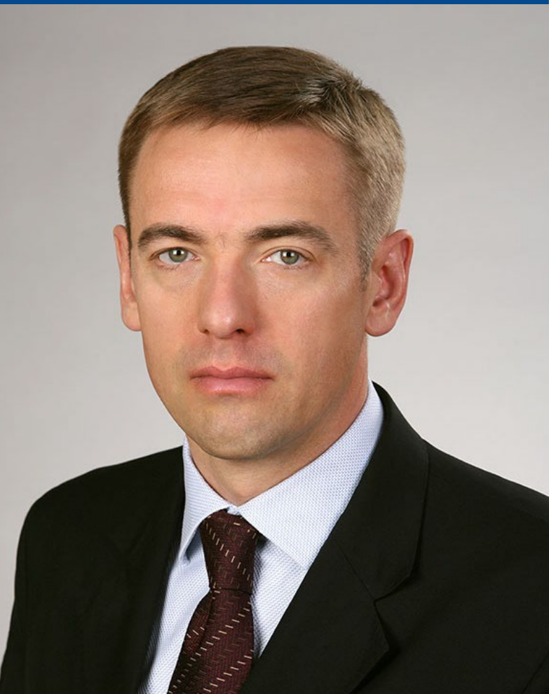
В.Л. Евтухов – статс-секретарь – заместитель Министра промышленности и торговли Российской Федерации